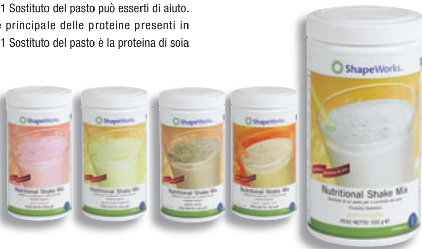
Vaniglia Cod. 0141 Cacao Cod. 0142 Fragola Cod. 0143 Frutti Tropicali Cod. 0144 Cappuccino Cod. 1171

Inoltre, puoi scegliere il tuo frullato tra 5 fantastici gusti: Vaniglia, Fragola, Cacao, Frutti Tropicali, Cappuccino. Vedrai che inizierai con il tuo gusto preferito e poi.....non potrai fare a meno di provare anche gli altri!