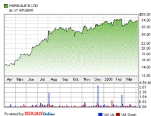
Grafico prezzi del titolo Herbalife Nyse (quotazioni giornaliere in $)